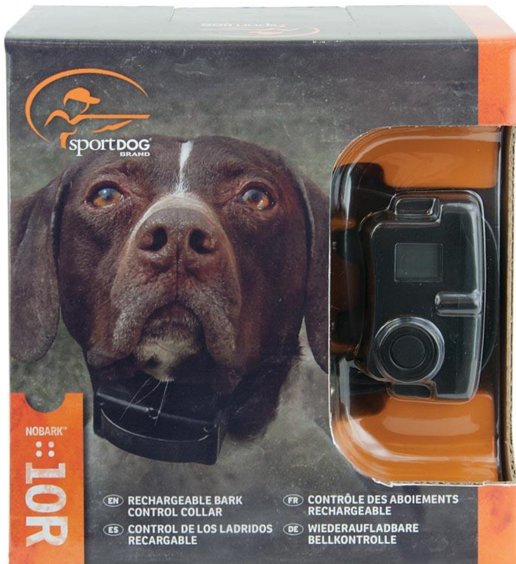
SportDog ogrlica protiv lajanja